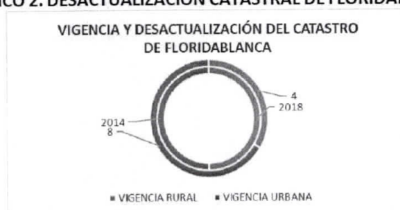
GRÁFICO 2. DESACTUALIZACIÓN CATASTRAL DE FLORIDABLANCA

El municipio tiene programado actualizar el área urbana y el área rural en tanto que para el 2024 esta zona urbana estaría en los seis años de desactualización. Es una necesidad urgente para el Floridablanca tener datos actualizados de su base catastral como fuente importante de ingresos para el municipio con miras a los programas de inversión en mejora de su infraestructura física.